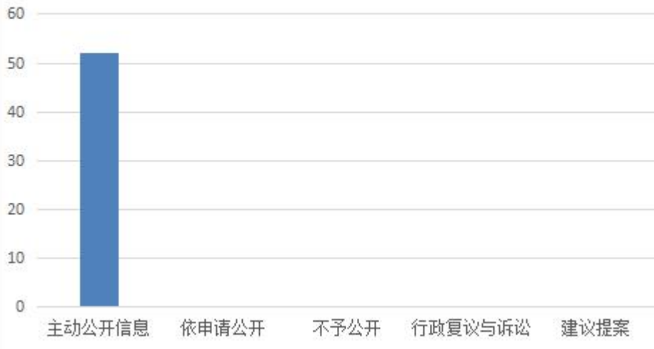
投融资2019年度信息公开总体情况