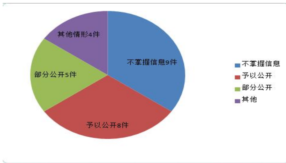
(2021年信息公开申请答复情况)