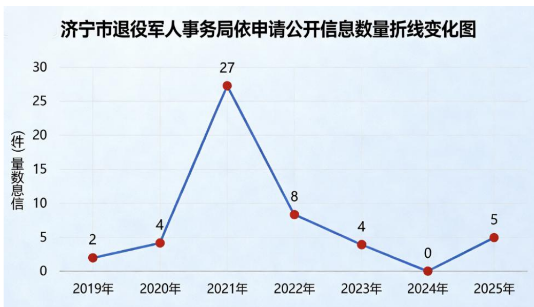
依申请公开数量变化图